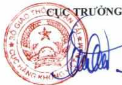
Đinh Việt Thắng