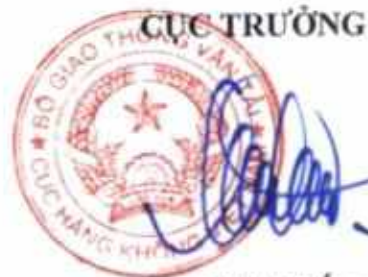
Đình Việt Thắng

Cam kết của lãnh đạo Cục Hàng không Việt Nam và lãnh đạo các phòng chuyên môn thiết lập hệ thống nguồn nhân lực đáp ứng yêu cầu của Tổ chức hàng không dân dụng quốc tế và thực tiễn quản lý hàng không dân dụng Việt Nam nhằm đảm bảo an toàn hàng không. ve