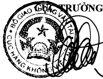
Đinh Việt Thắng